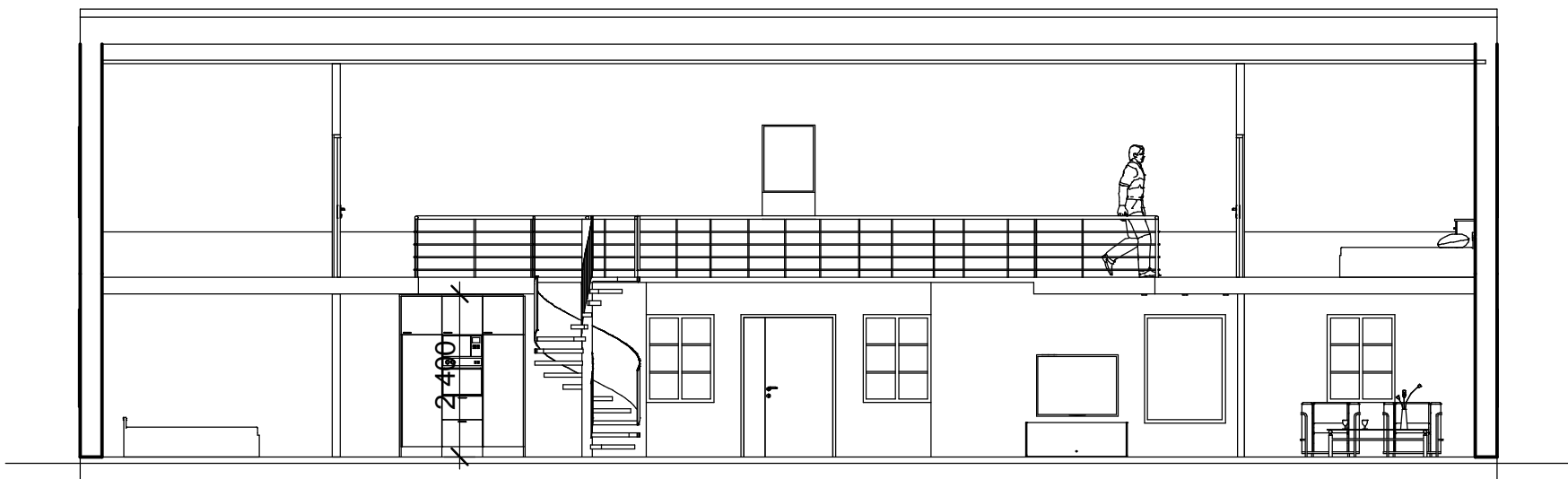
Sektion B-B 1:100